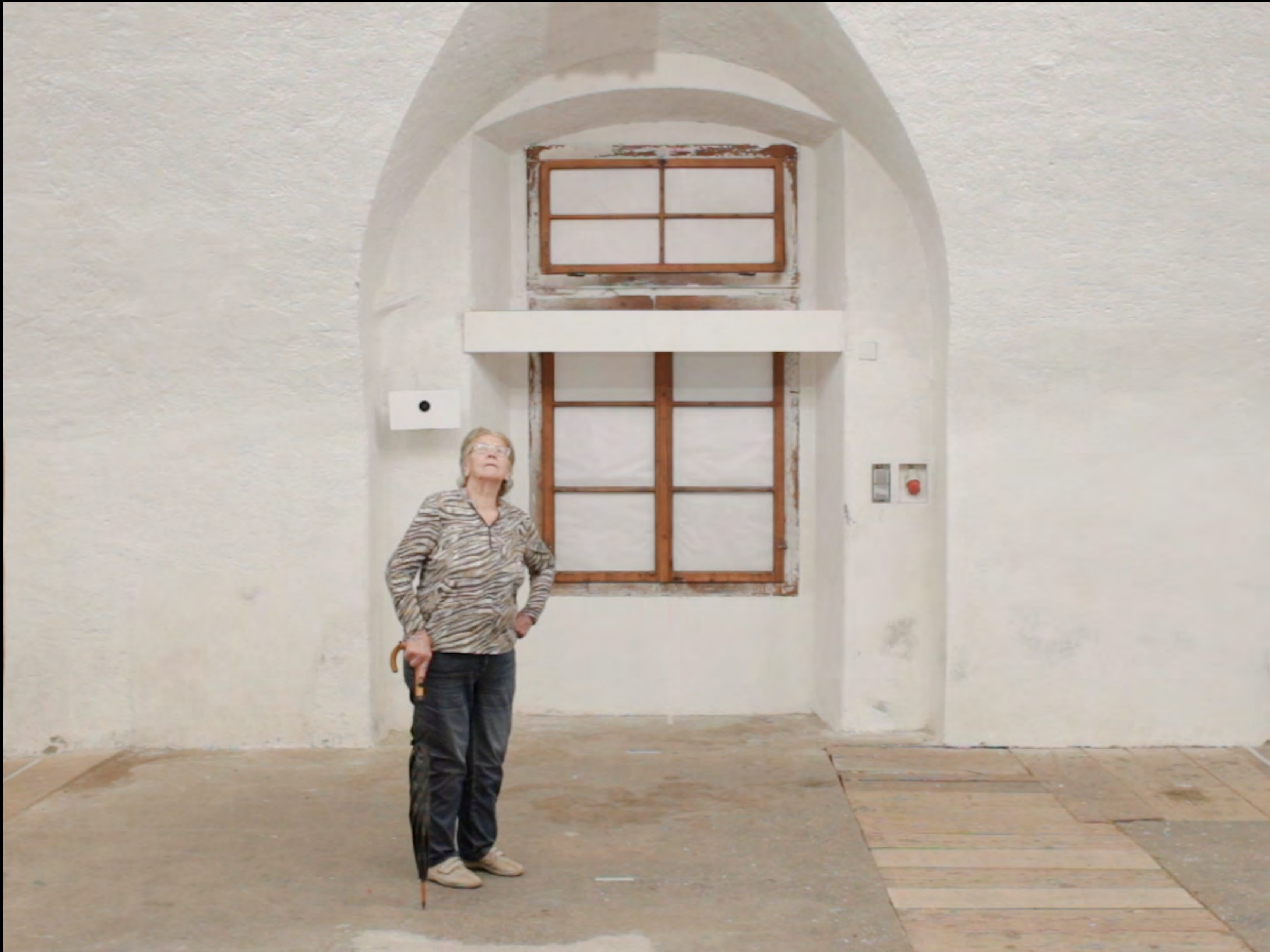
Ein Kammerspiel, 2023