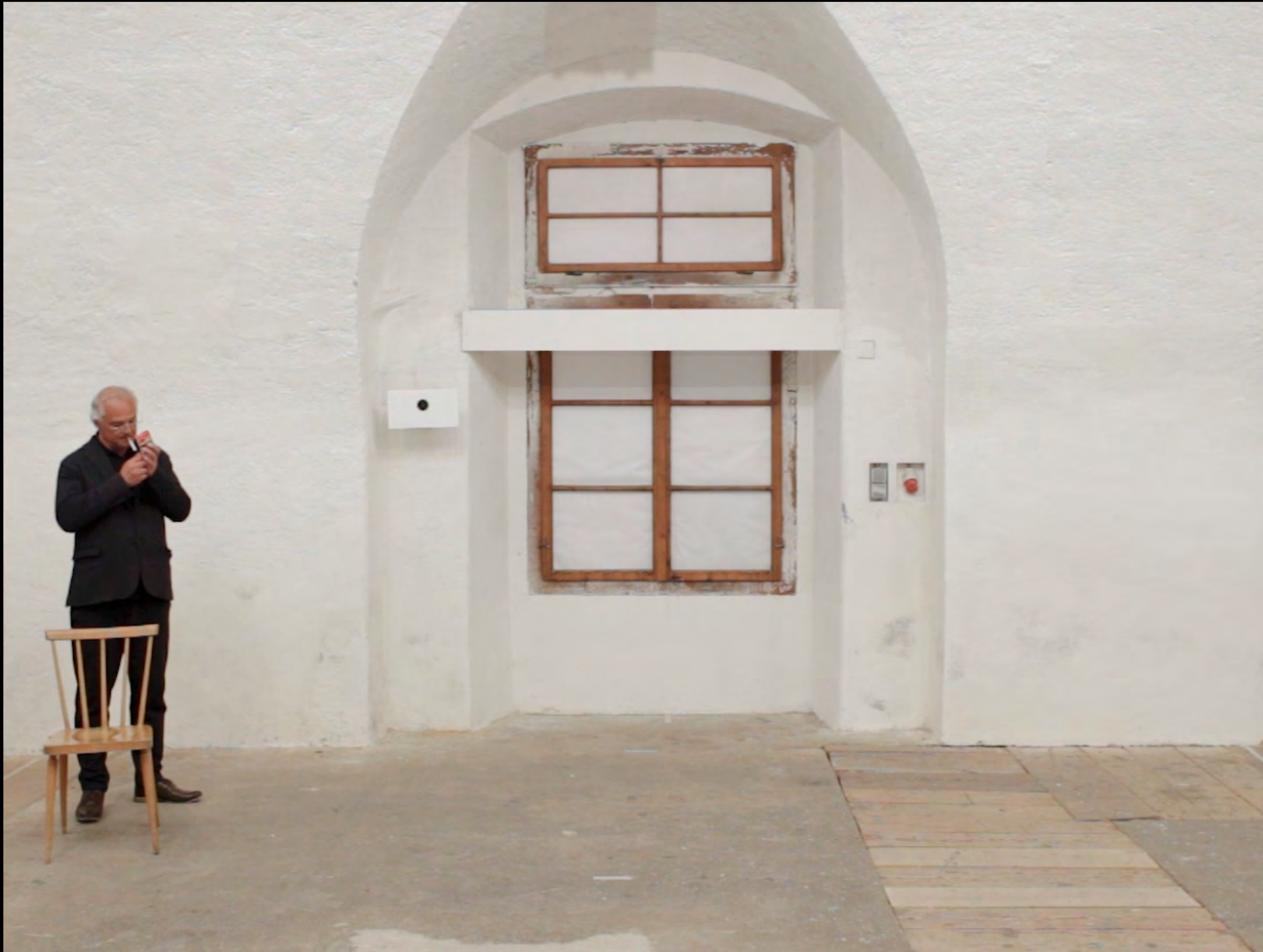
Ein Kammerspiel, 2023